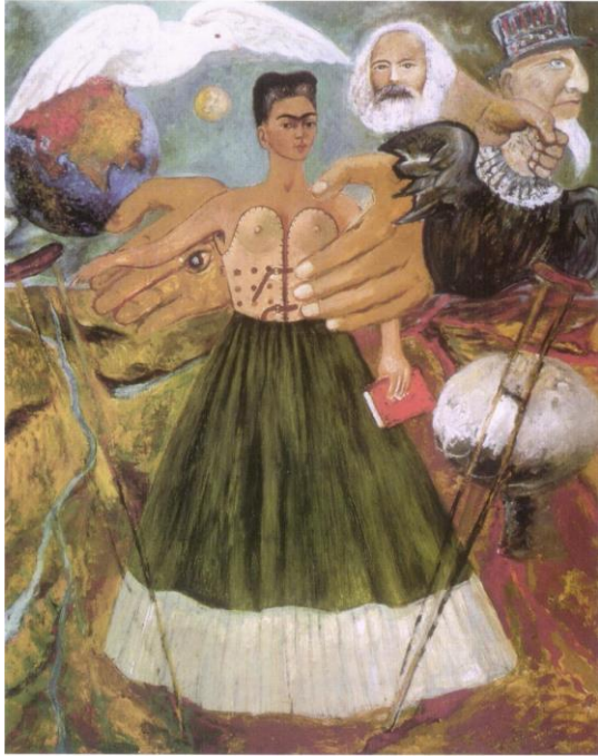
F. Kahlo, Il marxismo curerà tutte le malattie , 1954, Museo Frida Kahlo, Coyoacán, Messico

https://www.kahlo.org/it/il-marxismo-guarira-gli-infermi/